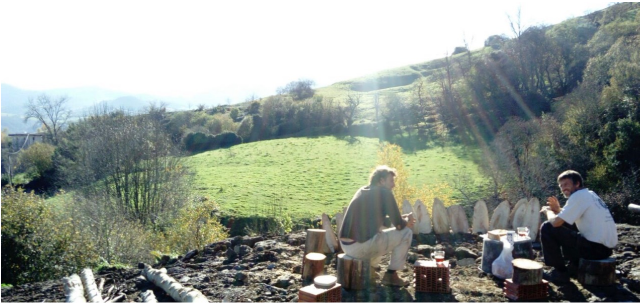
Vistas desde el terreno